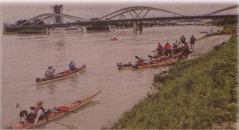
Die Kajakfahrer bei der gestrigen Ankunft in Linz.